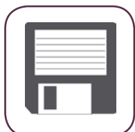
Memoria temperature impostate