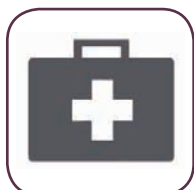
Modalità Dyagnostic System