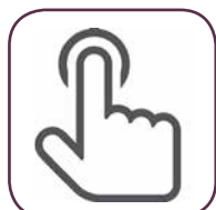
Comandi avanzati Soft Touch