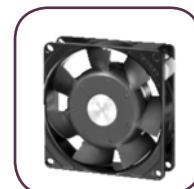
D.A.C. Dynamic Air Cooling