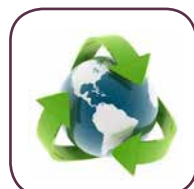
Gas ecologico R600a