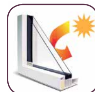
Vetro Triplo strato anti UV