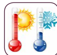
Sistema Freddo / Caldo