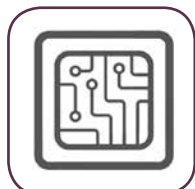
Controllo temperatura evoluto